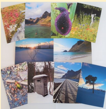
10 wenskaarten zonder tekst + omslag: € 10,00