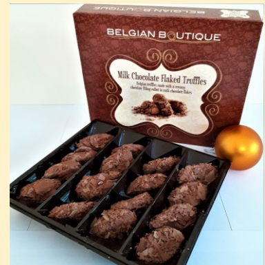
Caluwé Chocoladetruffels 200g: € 6,00