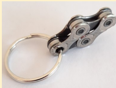
Sleutelhanger: € 3,00