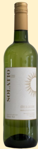
Witte wijn 2019 Solatio, IGP Gascogne: € 7,00