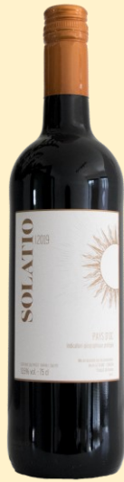
Rode wijn 2019 Solatio IGP d'Oc: € 7,00