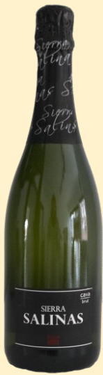
Cava Sierra Salinas Brut: € 9,50