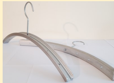
Kapstok van oude fietswielen: € 5,00