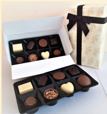
Caluwé Pralines in geschenkverpakking 237g: € 10,00