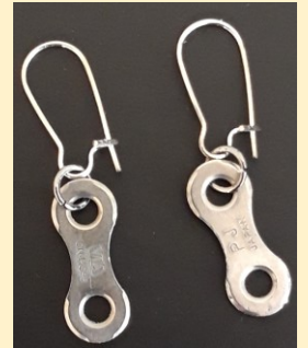
Oorbellen: € 5,00