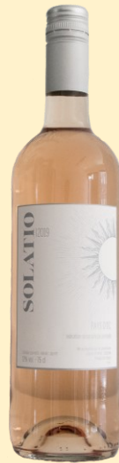
Rose wijn 2019 Solatio, IGP d'Oc: € 7,00